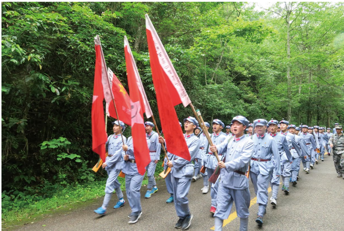
革命后代赴井冈山开展红色主题教育