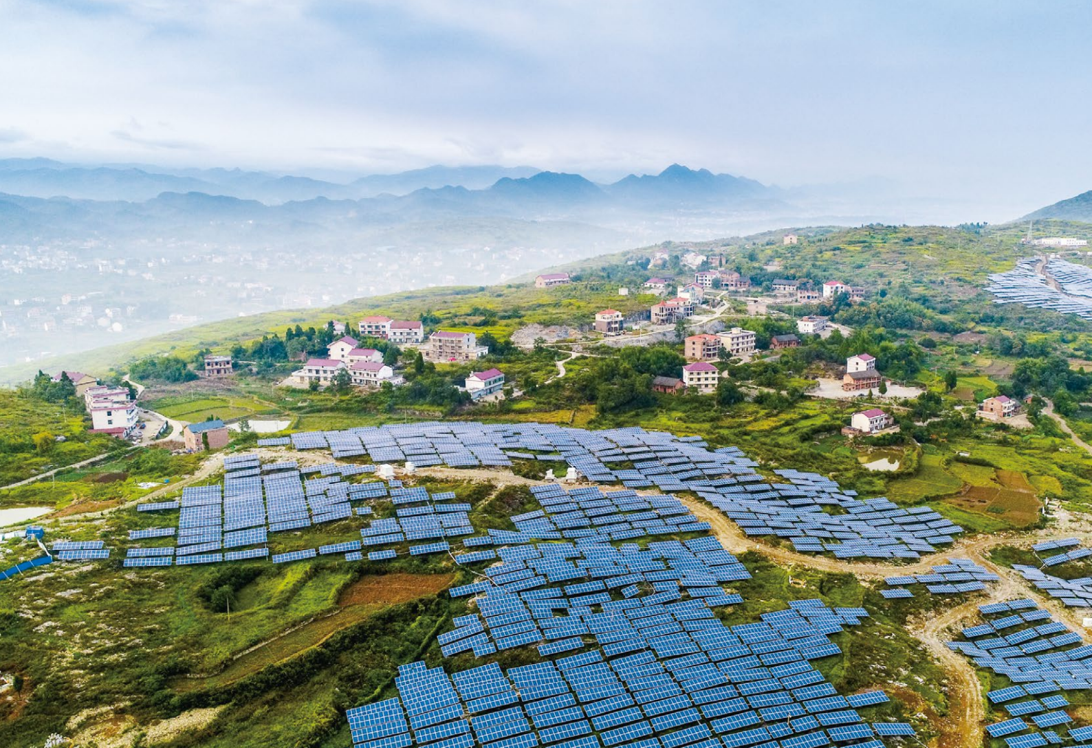
生机勃勃的乡村振兴“春日画卷”