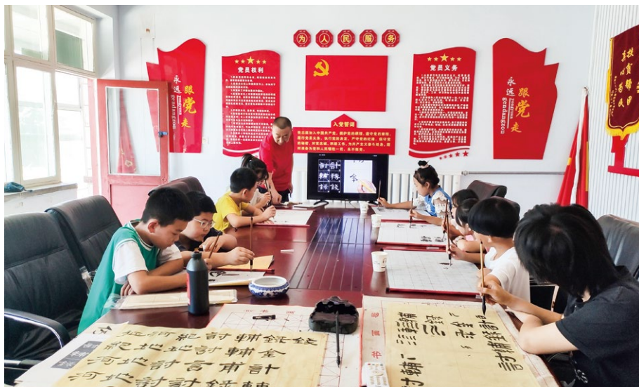
驻村队员开设书法班提升学生素养

然而现实却有些“骨感”，书法班在开课后并没有想象中的火爆场面，很多学生家长仍然认为“有书念就行，上兴趣班有什么用”。为了转变村民们的思想，驻村队员们挨家挨户地招生，“班主任”