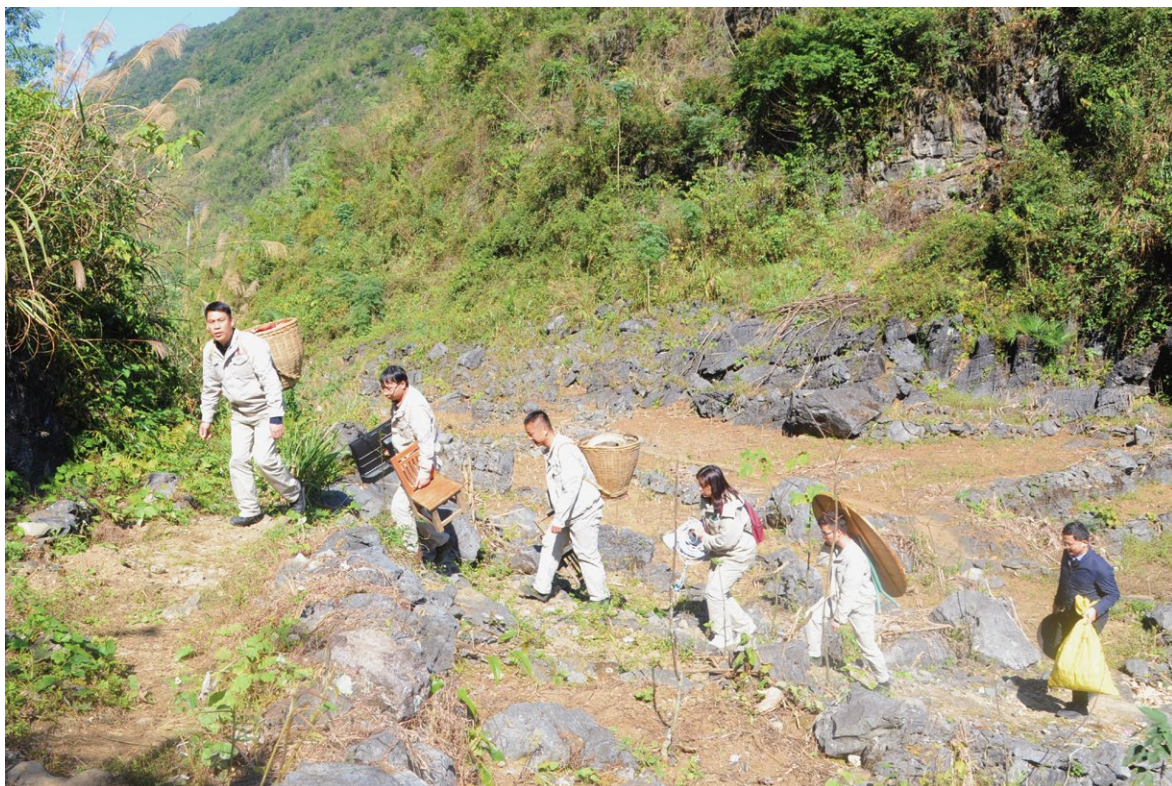
岩滩水电公司组织人员帮助安兰村民搬家

安兰村地处以喀斯特地貌闻名的广西大化县，尽管千山万弄、石峰林立，但是通过安兰村的道路却非常平整，公路蜿蜒盘旋在山峰之中，把这个深山中的宁静村庄与繁华的县城连通了起来。车辆行驶在路上，安全平稳；群众行走在路上，面带笑容。就是这些路，让大石山区的群众不仅有了“走出去”看世界的“明亮窗口”，更有了奔向共同富裕的“致富之路”。