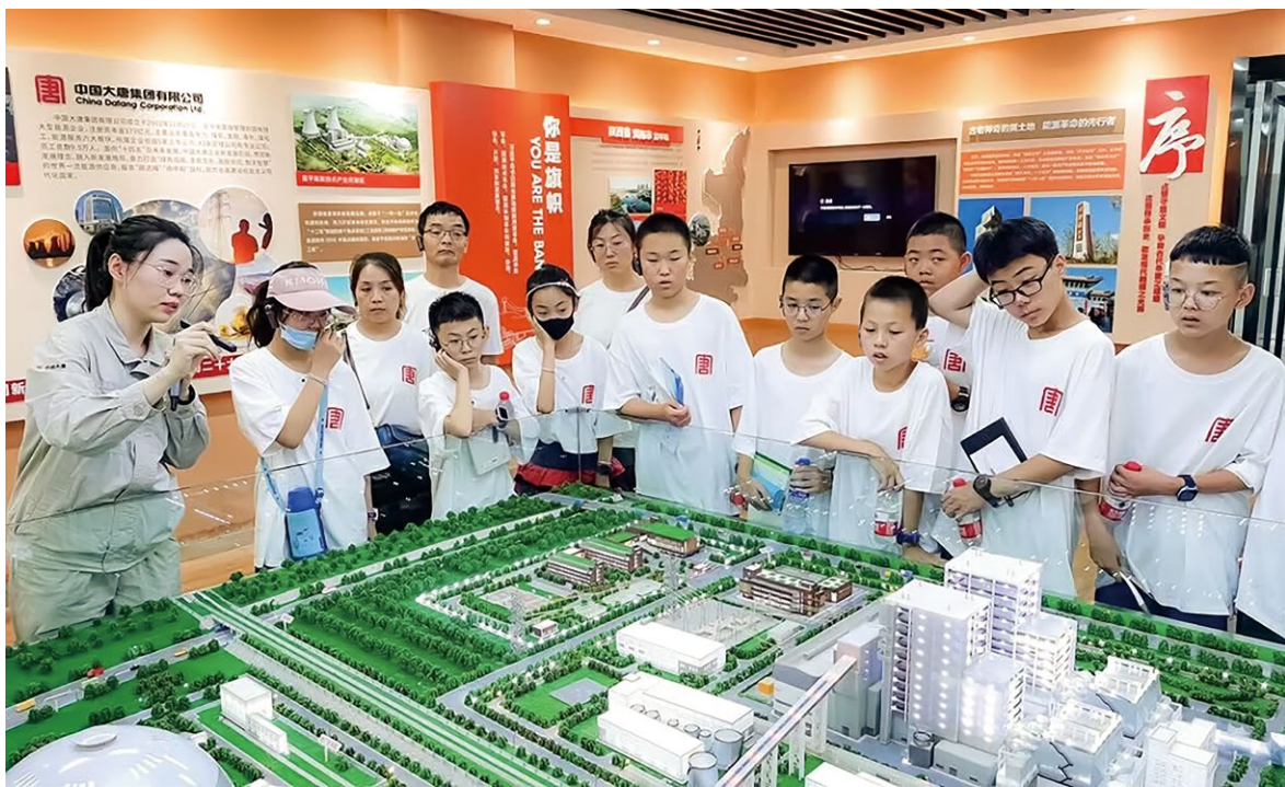
在“澄城英才·心系未来”主题暑期研学实践中,学生们来到大唐富平热电有限公司参观学习

在澄城县寺前镇中心学校体育场上,孩子们迎着和煦的春风奔跑、旋转、跳跃,脸上洋溢着最纯洁的笑容。此前,由于旧体育场基础设施薄弱,特别是陈旧的水泥路面常常导致学生们摔倒受伤,一定程度上制约了学生的全面发展。集团公司挂职干部经过实地调研,了解学校存在的困难后,主动向陕西公司汇报沟通,将寺前镇中心学校体育场提升项目纳入定点帮扶项目,改善该校室外体育设施。