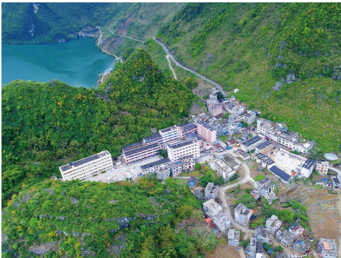
板兰村屋顶光伏电站