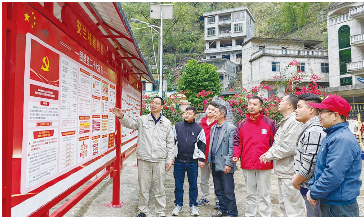
驻村工作队组织党的二十大精神学习

元宵节过后“龙抬头”，在这段时间里，中国大唐定点帮扶的广西大化县安兰村家家户户都要吃上一桌“开年饭”，预示着新的一年丰衣足食。按当地习俗，广西桂冠电力股份有限公司驻村工作队员和村干部也聚在一起“开年”。