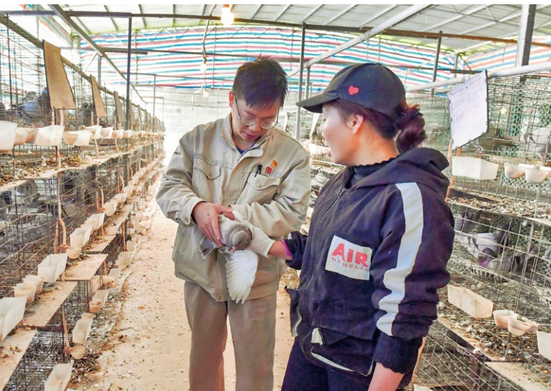
驻村队员与村民检查肉鸽养殖工作