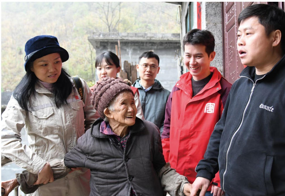
驻村工作队慰问老人纾困解难

近年来，桂冠电力公司始终把人才振兴作为乡村振兴的基础，经过了真心、真情、真金白银的帮扶，安兰村彻底摆脱了贫困，如今又沐浴着乡村振兴的春风，更多致富的“金凤凰”飞回家乡，让村里的种植、养殖产业壮大到了7项。2022年，安兰村不仅实现了脱贫人口人均收入增长13.1%，村集体收入增长142%，还获得了2022年大化县文明村镇的称号。