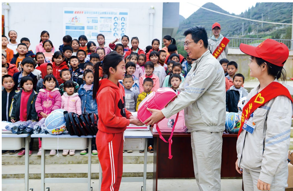
贵州发耳发电公司志愿者为帮扶村的学生赠送文具

“为党育人、为国育才”，大唐贵州发电有限公司将教育帮扶列为助力乡村振兴规划重点之一，积极探索教育帮扶新模式、新路径、新希望，用大唐力量点亮乡村振兴路，用大唐乡音、大唐爱心、大唐红心为大山深处的孩子们插上梦想的翅膀，用实际行动和大唐力量扛稳扛好央企使命担当、社会责任。