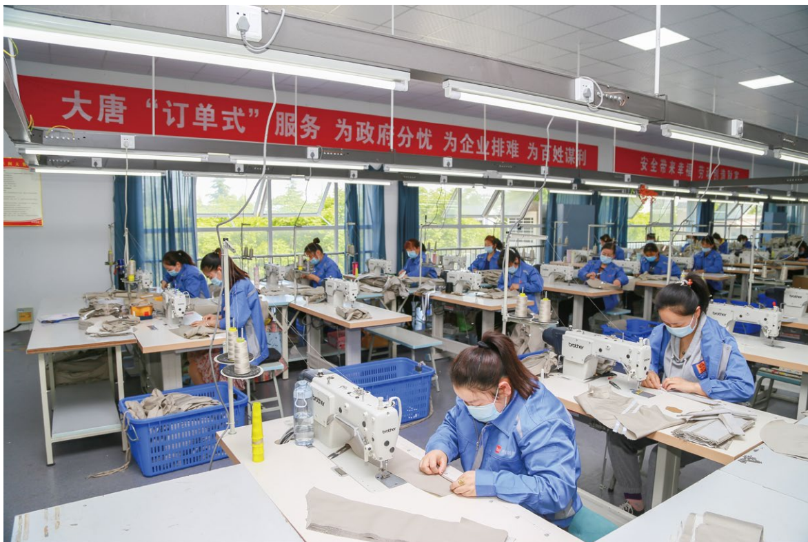
异地搬迁群众实现家门口就业

唯有稳定就业，才能夯实致富基础，实现拓展脱贫攻坚成果与乡村振兴有效衔接。澄城县整体脱贫摘帽后，移民搬迁涌现出大量闲置劳动力。集团公司因地制宜，引进订单式帮扶企业——唐威服装厂。如今，唐威服装厂实现3年累计总产值达4000万元，解决当地群众长期就业120余人，成为澄城县响当当的名片。一件件服装汇聚起乡亲们的点点汗水，助推澄城跑出乡村振兴加速度。