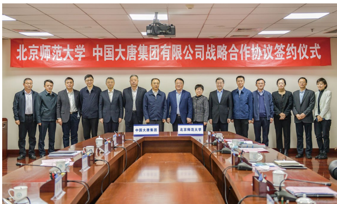
中国大唐与北师大携手推进教育帮扶

“条件好了就不怕没有好老师，缺编肯定是暂时的。”2022年，由中国大唐集团牵线搭桥联合北京师范大学与大化县签署教育帮扶的合作协议，竭力促成大化县高中获得教育部批准，成为北师大在广西托管的唯一一所中学。北师大选派校长已经进驻大化高中任“第一校长”，他将带领教职工开展教育改革工作，这消息一经传开，更坚定了教师们教书育人的信心。