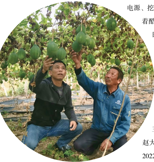
三尖铺村瓜蒞丰收

电源、挖临时引水渠、安装提水泵……工作队、村干部们与农户们一道顶着酷暑轮番上阵，经过20个不眠之夜，终于将淠河水引入干裂的稻田，保住了收成。