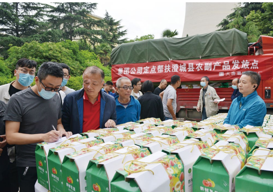
驻村干部助力消费帮扶

步入二楼直播室，“大唐助农·为爱下单”的标语映入眼帘。在2022年“央企消费帮扶兴农周”期间，驻村干部化身带货主播，一边带货、一边讲述产品背后的帮扶故事，吸引不少粉丝点击下单，通过“大唐直播间”销售的澄城农副产品达571.55万元。尤其是方圆200公里以内，农特产品更是实现24小时从田间到舌尖，着实让吃货们过了一把“嘴瘾”。