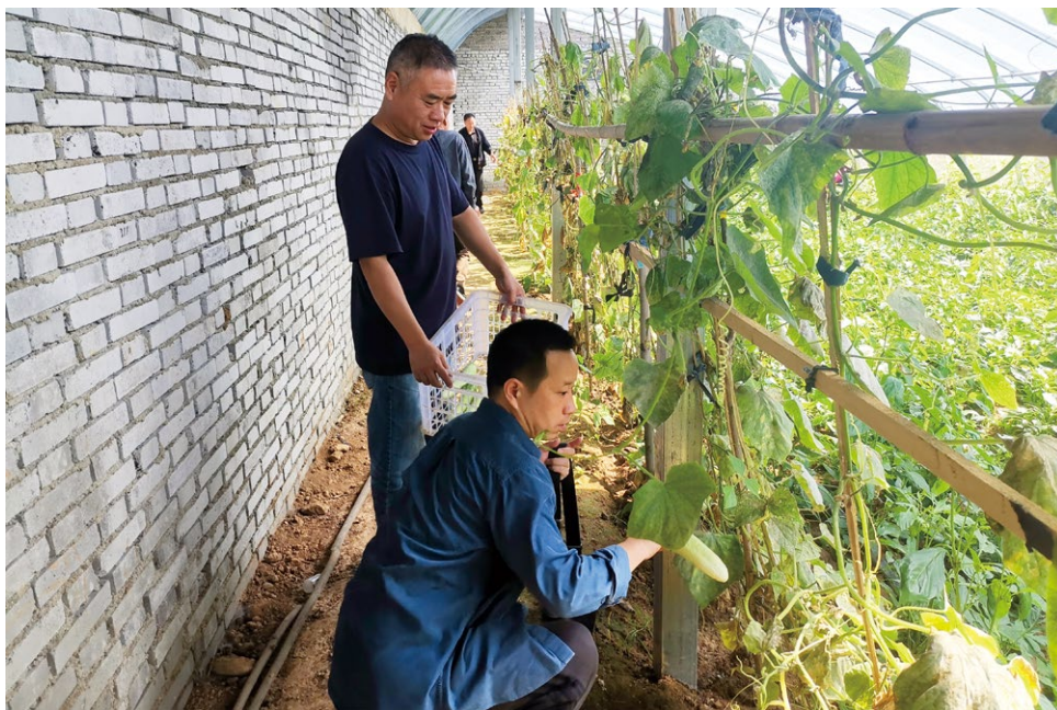
大棚种植带动村民增收