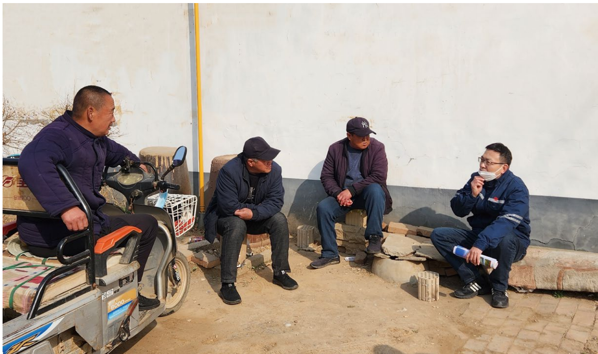
驻村第一书记在街道为村民宣讲党的政策