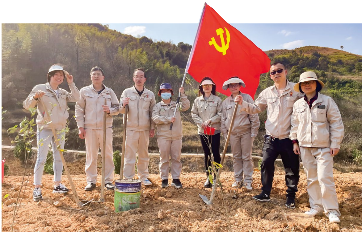
党团员志愿者在水口村药材基地植树

位于湖南耒阳余庆街道的水口村，距离城区 30 公里，山峦堆叠，怪石林立，水流潺潺，一派原始风貌。这里有高滩瀑布，奇山异水、风光无限，就像一块未经雕琢的“璞玉”，散发出浓浓的诗情画意。可谁曾想到，这个被誉为“小九寨沟”村落也曾“与世隔绝”无人问津。