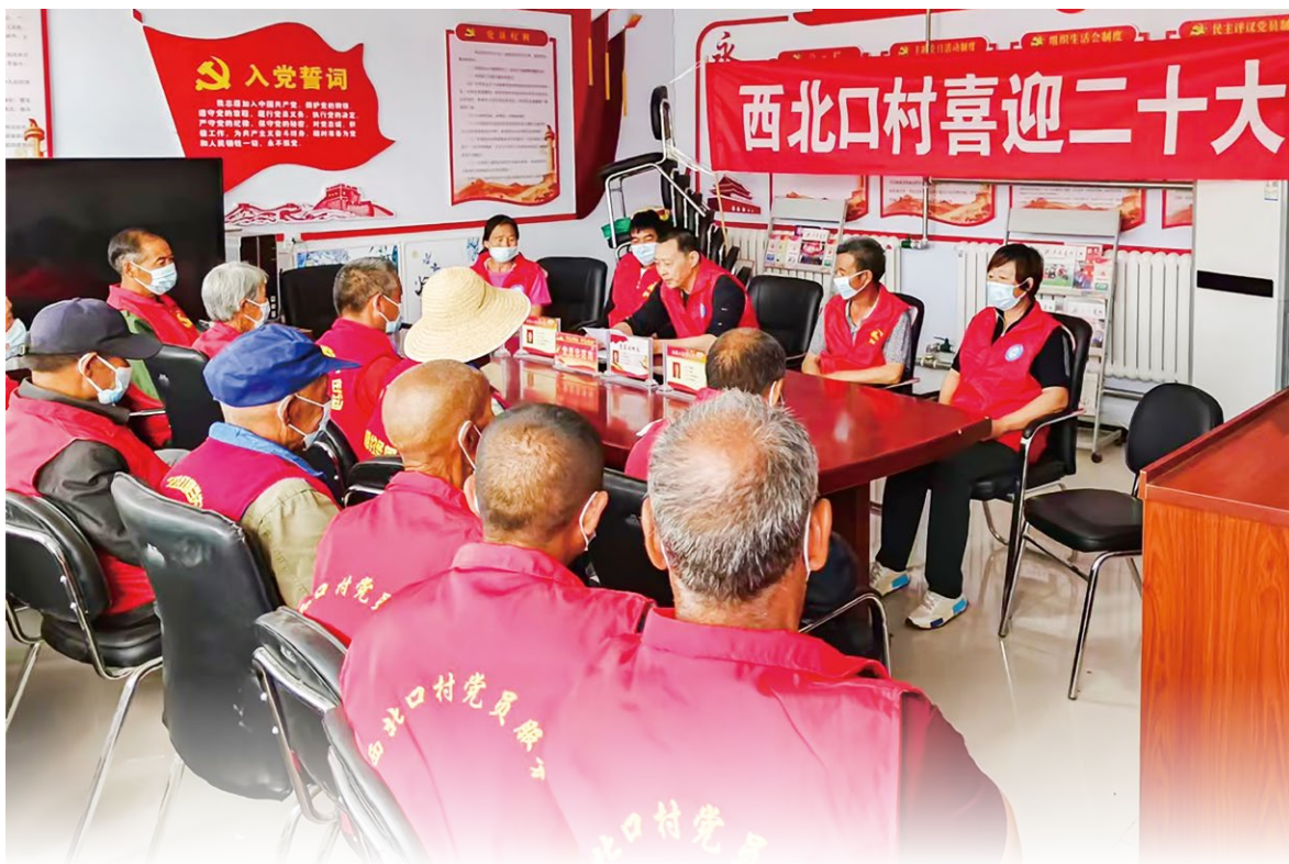
驻村工作队组织村里党员上党课