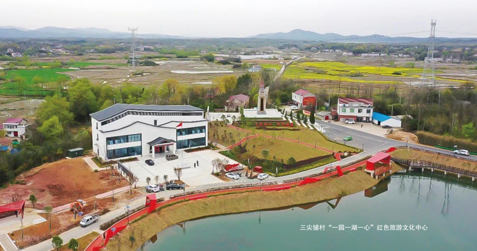
三尖铺村“一园一湖一心”红色旅游文化中心

一切准备就绪，经过精心挑选的优质稻“华夏香丝”带着大家的满满期待种入田中。然而，正当田里热火朝天忙种植的时候，一场干旱不期而至。工作队立即组织起“三尖铺娘子军插秧队”，接