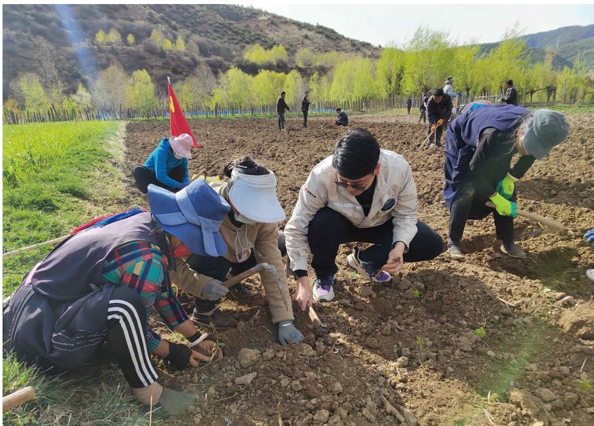
驻村队员与村民种植草药